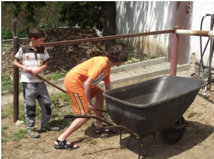
Práce na ranči v Hostěnicích.

Jednou za čtrnáct dní jednou klienti do Hostěnic, kde se nejdříve věnují pracím spojených s chodem velkého ranče a poté si za odborného dohledu připraví koně k jízdě, s možností projet se na koni za odborného dohledu.