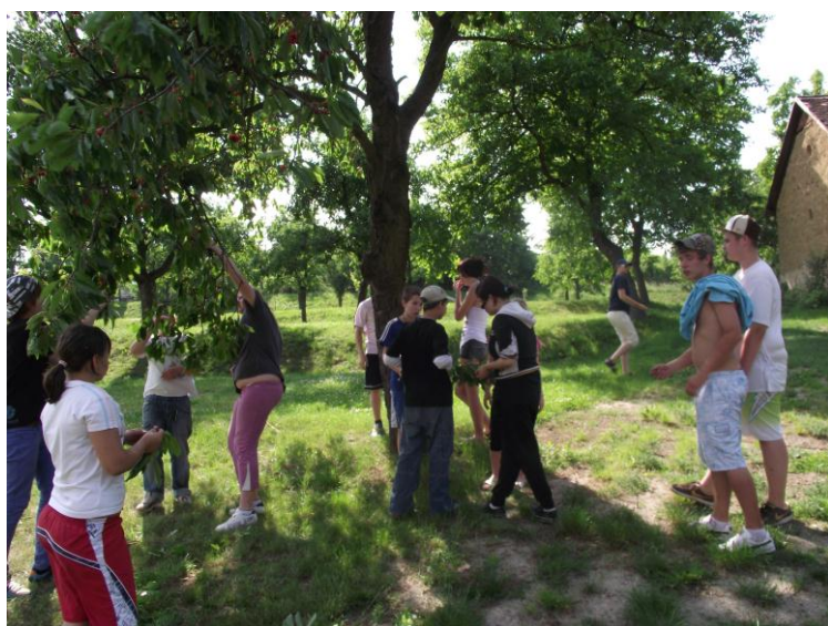
Víkendový pobyt na faře v Čučicích.

Dvakrát v roce, na jaře a na podzim tráví děti víkend na faře v Čučicích. Během těchto dnů klienti pomáhají s pracemi na faře samotné, chodí na výlety a hrají mystické večerní hry s námi předem daným psychologickým dopadem.