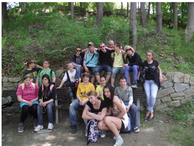
Návštěva Dětského domova se školou v Jihlavě.

Také se klienti účastní různých exkurzí v obdobných školských zařízeních, včetně každoroční návštěvy Dětského domova se školou v Jihlavě.