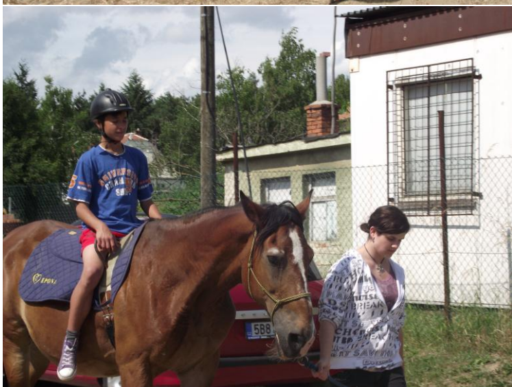
Jízda na koni v Hostěnicích.