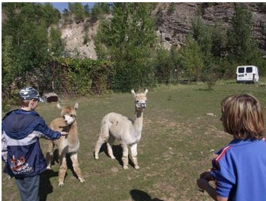
Návštěva v Lamacentru

Během celého pobytu se klienti pravidelně účastní jak výchovně terapeutických programů, jako například arteterapie či canisterapie, tak různých volnočasových aktivit. Vychovatelé pořádají pro děti návštěvy výstav, celodenní i půldenní výlety, sportovní akce, exkurze apod.