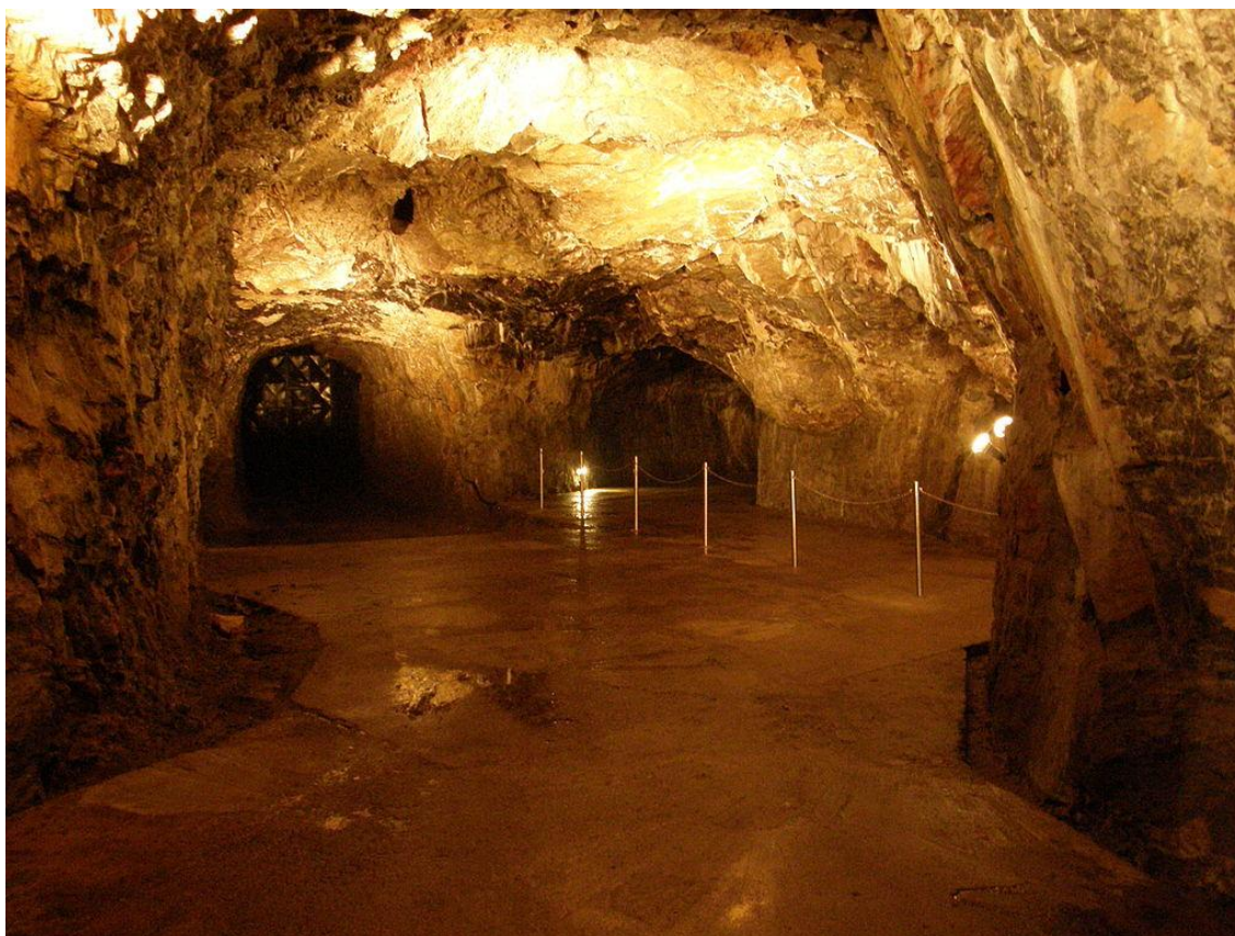
Jeskyně Výpustek

Na závěr školního roku jsme opět uspořádali „rozlučkový“ výlet. Navštívili jsme město Křtiny s nádherným kostelem Jména Panny Marie, dále také Kostnici a následně jsme absolvovali prohlídku jeskyně Výpustek.