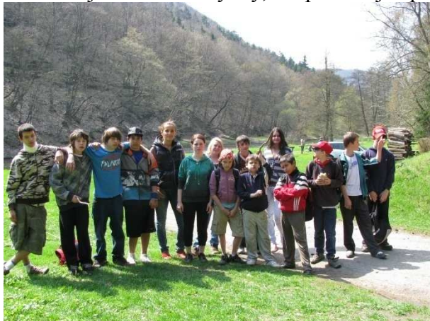
„Společné foto před výletem do Oslavan podél řeky Oslavy“

Dvakrát v roce, na jaře a na podzim tráví děti víkend na faře v Čučicích. Během těchto dnů klienti nejen chodí na výlety, ale pomáhají s pracemi v areálu fary.